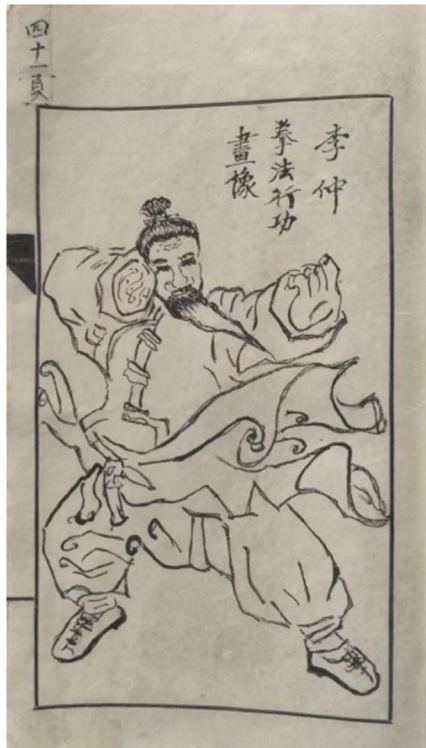
Fig. 7. Portrait of Li Zhong Demonstrating Martial Arts.