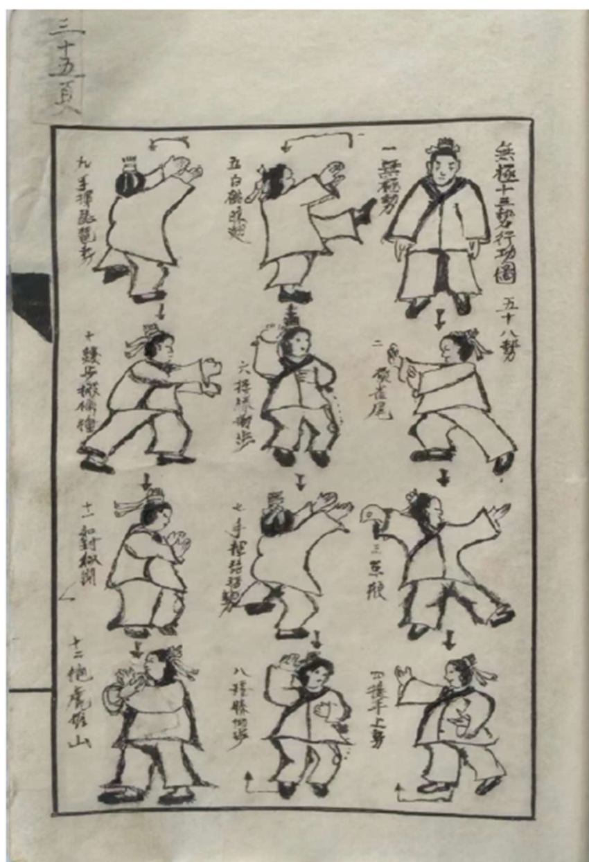
Fig. 18. Action Diagram of 58-Posture Routine for Thirteen Momentums of Wuji HPMA.