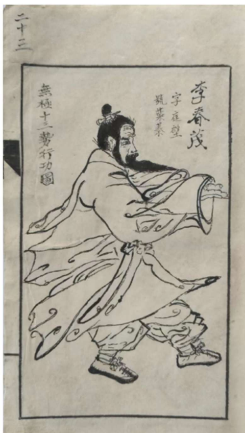
Fig. 4 - Illustration of Li Chunmao Demonstrating the Practice of Wuji HPMA.

Just tekstiosas „Taiji Yangsheng Gong käsiraamat“, mille on 1798. aastal pannud kirja Li Yongda (Li Helini vanim poeg), on joonised Wuji 13 liikumise kohta. Kahjuks on avaldatud ainult mõned üksikud joonised: